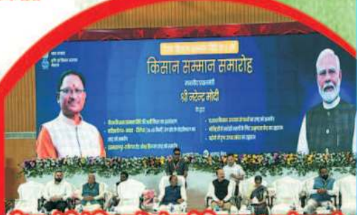
पीएम मोदी ने किसानों को जारी किए 599 करोड़ रुपये