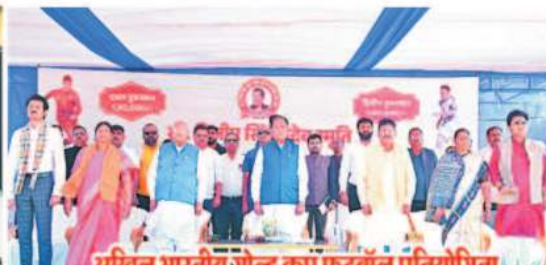
अखिल भारतीय गोल्ड कप फुटबॉल प्रतियोगिता के समापन कार्यक्रम में शामिल हुए मुख्यमंत्री