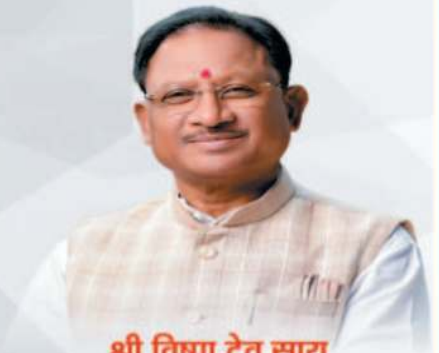
श्री विष्णु देव साय माननीय मुख्यमंत्री, छत्तीसगढ़