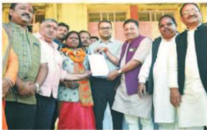
जिले के नगरीय निकाय निर्वाचन की मतगणना हुआ संपन्न