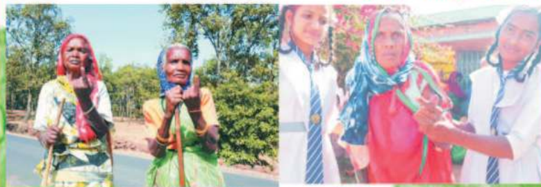
जनपद पंचायत बगीचा में मतदान को लेकर भारी उत्साह