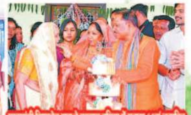
मुख्यमंत्री विष्णुदेव ताय ने गुरुग्राम बंगला में मनाया 6वां जन्मदिन