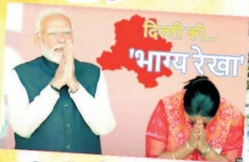
दिल्ली की 'भाग्य रेखा' दिल्ली में 27 साल बाद बीजेपी की सरकार