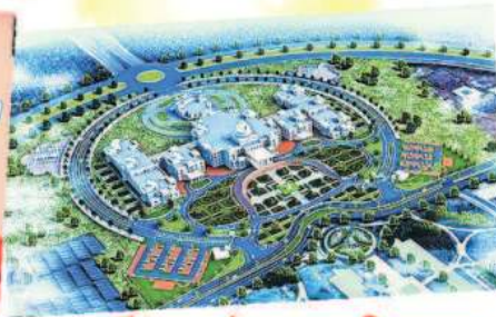
जल्द तैयार होगा छत्तीसगढ़ का नया विधानसभा भवन